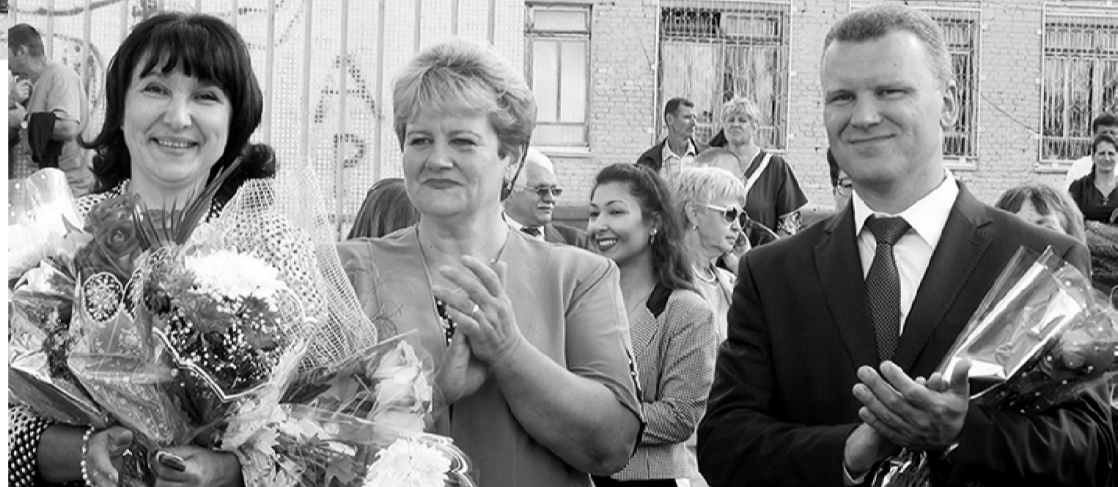
Л. ЕГОРОВА. Фото автора.